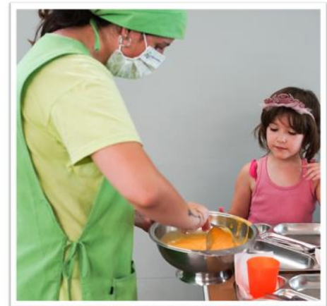
Davant de símptomes seguim protocol sense alarmismes