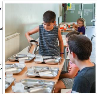
L'ús de gerres d'aigua es fa de forma assistida per part d'un monitor o bé d'un únic infant que fa de cap de taula

A la nostra escola habilitarem un nou espai de menjador a la planta baixa de l'edifici nou, en concret davant de les aules d'infantil seqüenciant els torns per grups. Al menjador habitual llavors quedarien primària i ESO, amb espai i més seqüenciació dels torns.